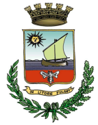
CITTA' DI PORTO SANT'ELPIDIO

Via Venezia n.34 (Tel.-Fax: 0734/991438 - Cell. 348/8872630) 63821 PORTO SANT'ELPIDIO (Fermo)