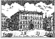
Senato della Repubblica

Le iscrizioni e le opere potranno essere consegnate personalmente o inviate per corrispondenza al seguente indirizzo: Centro d'Arte e Cultura "LA TAVOLOZZA" – Via Venezia n. 34 – 63821 PORTO SANT'ELPIDIO (FM) – Tel. 0734/991438 – Cell. 348.8872630, entro domenica 07 ottobre 2012, allegando alla cedola d'iscrizione la fotocopia della ricevuta del versamento. Le iscrizioni potranno essere altresì preavvisate via telefax al numero: 0734/991438. Le iscrizioni saranno comunque validate dalla ricezione della cedola d'iscrizione e dall'incasso del contributo di partecipazione. Le iscrizioni, in qualsiasi modo pervenute (posta, telefax), costituiscono prenotazione di spazio espositivo per le opere iscritte, pertanto impegnano il sottoscrittore al versamento del contributo di partecipazione.