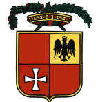
PROVINCIA DI FERMO